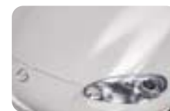
Argent lumineux métallisé