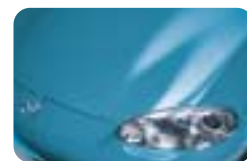
Bleu cristal métallisé